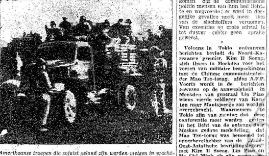
Amerikaanse troepen die onlangs in land zijn worden meelien in vragingsgezelschapen door persuur naar het front. (radiofoto).

Onmiddels hebben de Amerikanen Dinsdag en Woensdag twee nieuwe divisies naar Korea overgebracht, aldus senden correspondenten van de Reuter en U.P. die zich aan hoord van de berichten bevonden, deel uitmaken van de vijftienden, welke deze amphibische landingsdrachten aan land brachten: de troepen landden vrijdag in de Zuid-Koreaanse haven Pohang-Dong, 100 km. op de ziele breedtegraad van Noord-Korea. Van de voornaamste Amerikaanse aanvoerders in Zuid-Korea, Pusan, elf ongeveer 76 km. ten Zuiden van Wladivostok, Noord-Korea stiek de Donsdag in de ochtend aan land. Bij de landingen werd geen tegenstand ondervonden en onder bescherming van vliegtuigen rukten de eenheden onmiddellijk op. Britse oorsschepen hadden zich bij de zeede Amerikaanse vloot gezegd om hulp te bieden van de eendracht en dekkingsvaart moesten worden afgegeven ter bescherming van de landende troepen.